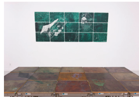
《中学性日記(モザイクとレジェンド)》2009

当時の担当者に「相談だけど、ここの明倫小学校時代の古い机と新しい机を交換できませんか」って訊いたら、「まあ、それならいいんじゃないか」となって物々交換した。それでちょっとポロい、落書きがあるような机を手に入れたんです。その頃から割とゲリラ的にやっていて、なんとか上手くやってこれました。