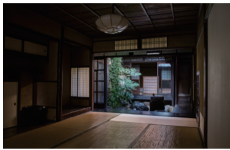
ANEWAL GALLERY 内観

京都芸術センターには宿泊設備がありません。過去にレジデンスプログラムに参加したアーティスト達には、近隣のマンションなどを滞在期間中に提供していましたが、とはいえ折角京都に滞在するのだから、風情のある場所に住んで