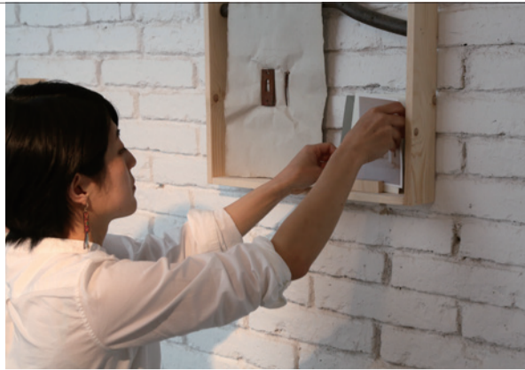
バルセロナでの滞在制作の様子